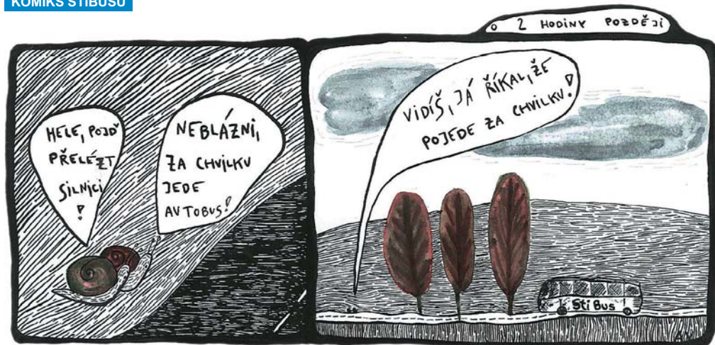
Komiks: Aneta Věrná