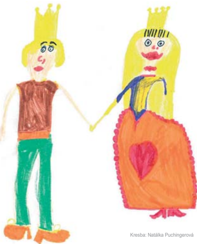
Kresba: Natálka Puchingerová

díkům tým zjišťoval, jestli jim závodnice pomohou nebo budou myslet jen na vlastní vítězství a nechají chudáky na pospas jejich osudu. V lese tak bylo možné potkat třeba Jeníčka a Mařen-