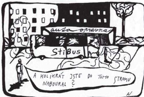
Komiks: Aneta Věrná