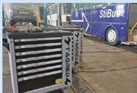
Žádné nářadí se už neztratí. Každý pracovník dílny má nově svůj profesionální box.