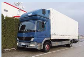
Největší nákladní vůz u Sti-Busu, Mercedes-Benz Atego 1223L, uveze až 5,5 tuny.