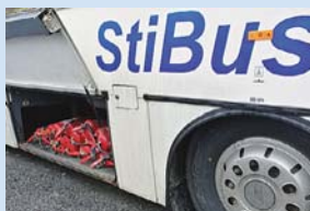
Hasičí přístroje se dočkaly pravidelné revize a k tomu si udělaly výlet autobusem.