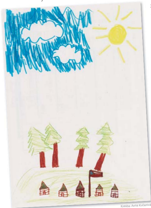
Kresba: Anna Kučerová

tů země. Cesta byla velice nebezpečná, kamarádi se střídali na hlídce ve dne, v noci, učili se rozdělat oheň a ulovit dostatek potravy pro sebe i ostatní. Když už byli téměř u cíle, narazili na místní kmen indiánů a došlo k potyčce. Tentokrát se však neobjevil žádný šerif, který by kovbojům pomohl, museli se spolehnout jen sami na sebe. Boje byly nelítostné, ale nakonec se jim přece jen podařilo indiány přesvědčit, že přicházejí v dobrém a na důkaz nového přátelství spolu vykourili dýmku míru. Léto uteklo jako voda a s ním skončil i tábor inspirovaný Divokým západem, na kterém Brzdík všechna ta dobrodružství zažil. Podobně napínavé ale může být i vaše léto, stačí, když vyrazíte na nějaký dětský tábor, jistě se jich ve vašem okolí pořádá mnoho. A je dost možné, že tam pojedete vašim oblíbeným StiBusem.