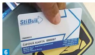
6 Po vyzvednutí karty si již jen denně užíváte pohodlně úhrady výhodnějšího jízdného.