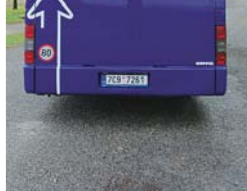
7x foto: Stibus magazín – Petr Šibor