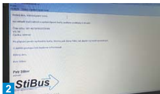
2 Na základě údajů, zadaných v žádosti obdržíte e-mailem konkrétní podklady k úhradě.