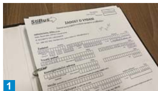
1 Žádost o kartu si můžete stáhnout na webu www.stibus.cz či si ji vyzvednout u řidiče.

Dopravní společnost StiBus nabízí cestujícím na pravidelných linkách možnost úhrady jízdného prostřednictvím bezkontaktní čipové karty. Na lince 340930 je v tomto případě uplatňována sleva 10 % z tarifu jízdného (kromě ZTP/P). U linky 320918 je vydávání karet možné pouze na příslušné obci dle místně platných tarifů.