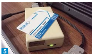
5 Nahrání dat na kartu probíhá formou bezdrátového přenosu. Poté je karta připravena.