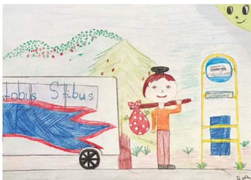
Kresba: Barbora Kulová

společných hrách. Silnější pomáhaly slabším a mladší se od starších učily plavat či lézt po skalách. Brzdíka bylo všude plno, nesměl zkrátka nikde chybět. Byl to on,