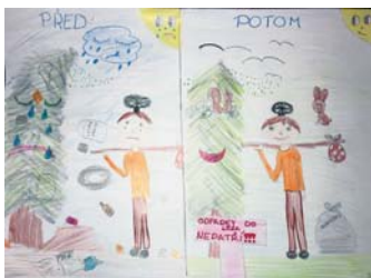
Kresba: Barbora Kulířová

„Copak se ti stalo? Ne, neboj, já ti neublížím. Jmenuju se Brzdík a chci pomoci všem smutným dětem i zvířátkům.“ Veverka chvíli váhá, ale nakonec ze sebe souká