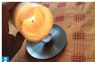
2 Nechte pořádně rozhořet kvalitní svíčku a voskem vyplňte skořápku.