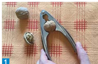
1 Ořechy opatrně rozlouskněte, abyste nepoškodili skořápku.