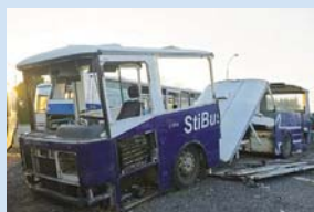
Pravidelná obměna vozového parku je nezbytná. Starému vozidlu se poděkuje a jede se dál.