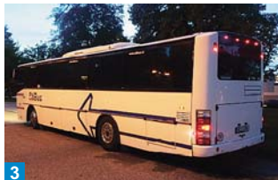
3 Zajímavostí tohoto vozu jsou LED žárovky zadních světlometů.