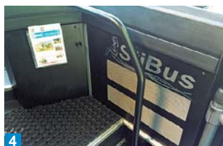
4 Kromě stylové výzdoby nesmí chybět ani zásoba StiBus magazinů.