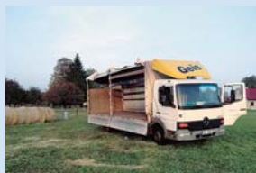
Nákladní vozidla StiBusu přepravují nejrůznější náklady. Někdy třeba i slámu.