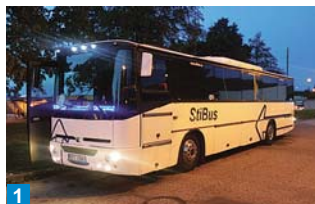
1 Vyladěný vůz je dobře vidět i v noci. Svítí i jmenovky řidičů.