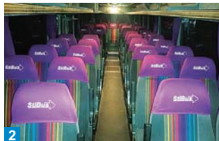
2 Potahy opěrek hlavy s logem StiBusu jsou ozdobou interiéru.