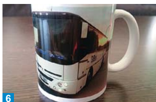
6 Káva v hmičku s obrázkem předěleného autobusu chutná nejlépe.