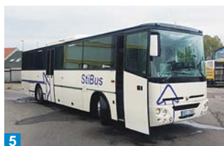
5 Perfektní čistota vozidla je základ. Na snímku po výjezdu z myčky.