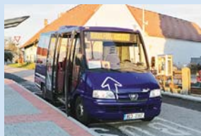
Ve dnech snížené přepravní poptávky využívá StiBus midibus VDL Jonckheere Pro City.