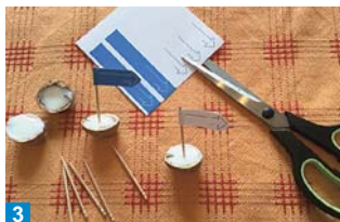
3 Do středu voskové výplně zabodněte párátko a ozdobte ho vlajkou.